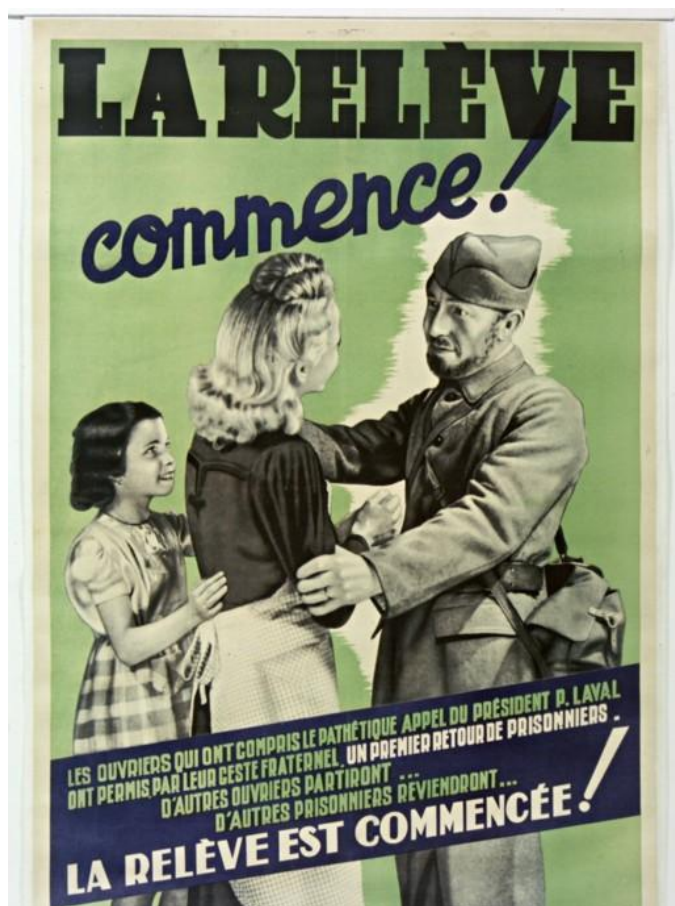
Document 1 : La Relève.

Cette affiche a été réalisée en 1942 par les services de propagande allemands pour susciter le départ volontaire d'ouvriers français vers l'Allemagne en échange du retour de prisonniers de guerre. Cette politique, mise en œuvre par Pierre Laval, chef du gouvernement, s'appelle la Relève.