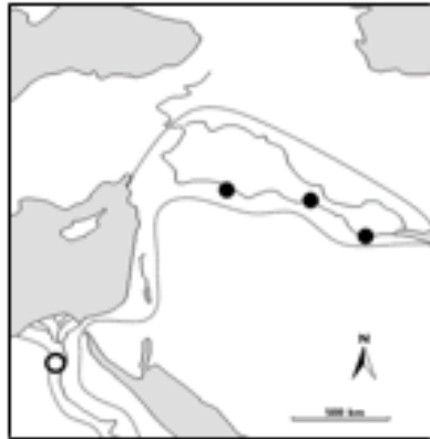
Document B : Carte du Croissant fertile.